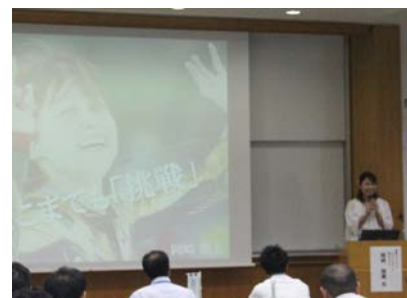
長野オリンピック スピードスケート 銅メダリスト 岡崎朋美氏による 基調講演の様子

本協議会では、今後も、様々なテーマで講習会等を開催し、全国の外郭団体と情報共有を重ね、各団体の持続的な成長とクオリティの高い組織体制・施設管理体制の構築、さらには、各団体が指定管理者として選定されるよう、スケールメリットを活かした事業展開を行っていききたい。